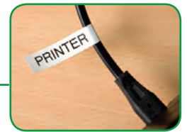
Identifier tous vos équipements électrique Étiquetage des câbles par exemple