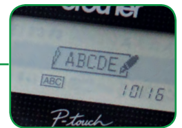
15 cadres décoratifs