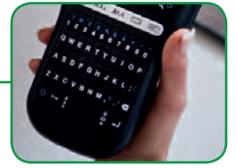
Design ergonomique Prise en main facile