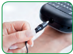
Emplacement pour adaptateur secteur Économisez des frais de piles en utilisant l'adaptateur secteur en option