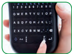
Clavier AZERTY La disposition familière des touches rend la saisie de texte rapide et facile