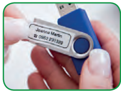
3 polices et 10 styles d'écriture Pour personnaliser vos messages